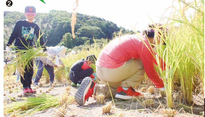
写真はかとう保育園 ▼かとう西保育園