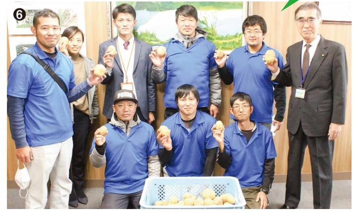
福津市ハジャガイモを寄贈