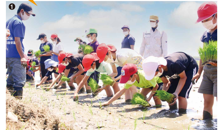
▲写真は勝浦小学校 ▲写真は玄海小学校