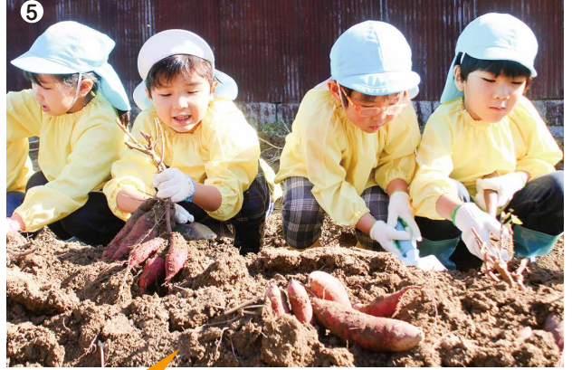
サツマイモの収穫体験