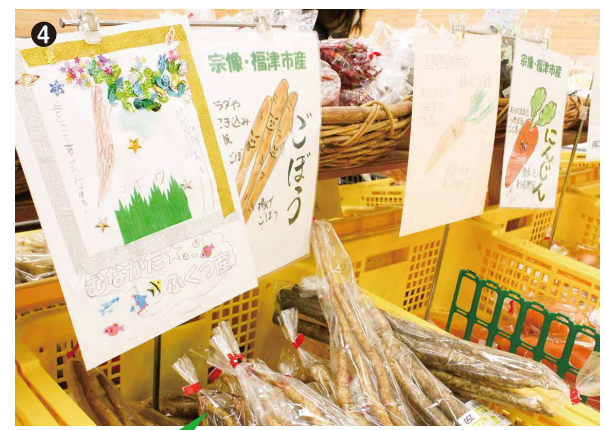
「ほたるの里」のポップを手作り