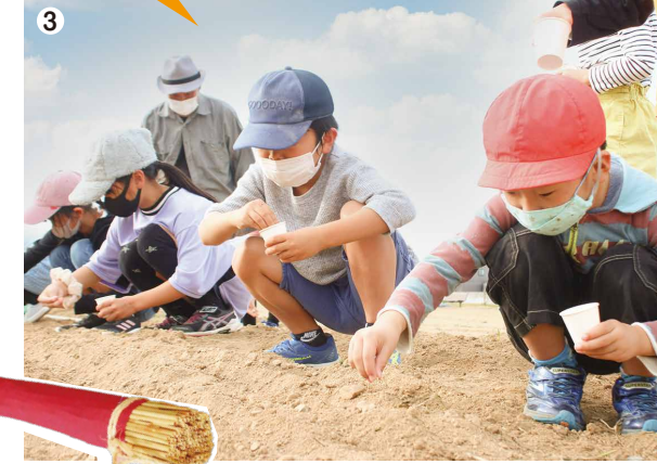
◀麦てっぽうを作る予定♪