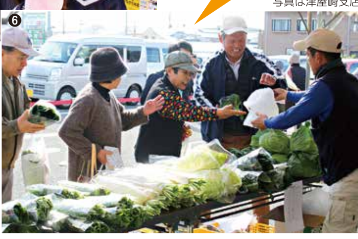
写真は津屋崎支店