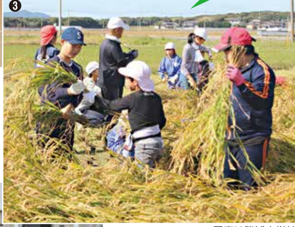
写真は勝浦小学校