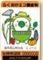
▲「ふくおかエコ農産物」認証マーク