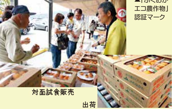
対面試食販売 出荷