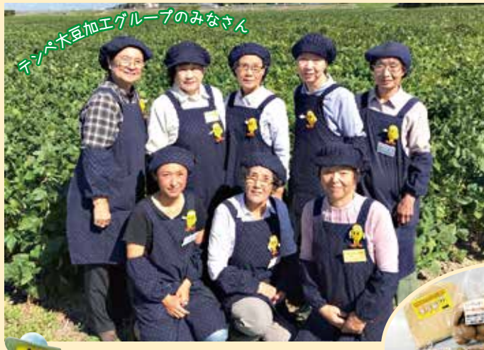
テンペ大豆加工グループのみなさん

テンペってなに? 大豆をテンペ菌で発酵させたインドネシア由来の発酵食品のことよ♪ どんなふうにして食べるの? ひき肉と合わせてハンバーグやつくねにしても美味しい、温野菜と混ぜてサラダにしても美味しいよ!