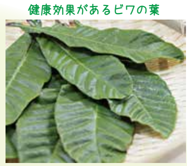
健康効果があるビワの葉

ビワの栄養は? カロテンを豊富に含んでおり、高血圧や脳梗塞、心筋梗塞などの生活習慣病やがんの予防が期待できます。 葉に多く含まれるタンニンにも生活習慣病の予防をはじめ、さまざまな健康効果があり、昔から薬として利用されてきました。