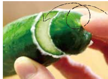
へたを切り口にこすりあわせる

どちらの方法も維管束に刺激を与えて液を外に出して、実の中の蟻酸を少なくしているんですね。