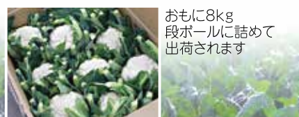
おもに8kg段ボールに詰めて出荷されます