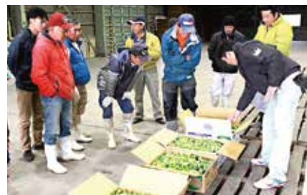
大きさや品質などの規格を確認