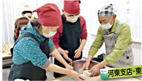
河東支店・東郷支店

2支店が合同で蕎麦作り体験を実施しました。9月の種まきから、蕎麦打ち・実食までを体験した皆さんからは「貴重な体験ができて楽しかったです」と嬉しい声も♪ 来年もがんばります!!