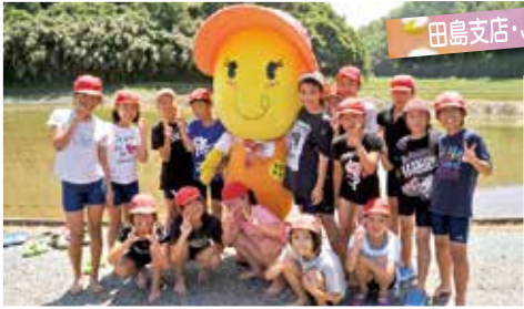
田島支店・JA青壮年部

玄海小学校の5年生が田植えに挑戦。泥だらけになりながら上手に苗で田んぼをいっぱいにしました。JA青壮年部の皆さんと「まいまいちゃん」も応援にかけつけました。