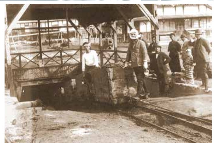
▲池田炭鉱坑口から石炭を搬出 (昭和6年頃)

♪朝もつうから 坑内さがるもネー、カンテラさげて、 坑内さがるもネー、ホンサー、手の為の ♪汗をふきふき 坑内出れば、 幼な紅葉のネー、ホンサー、手で招く (宗像式に優しい節まわりで歌われていた炭鉱労働歌)