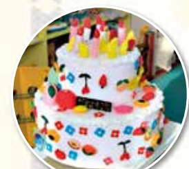
▲30周年を記念して作られたケーキ いろんな場面で登場します