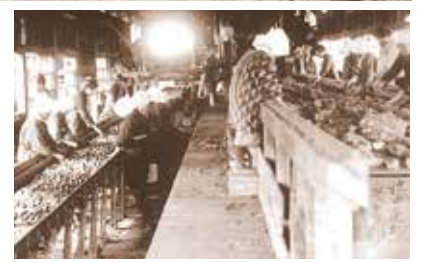
▲炭鉱選炭場での選別作業 (昭和6年頃)

昭和33年に石炭合理化法が制定されると、日本の重工業を永年支えてきた石炭産業はその役を石油に譲ることになります。昭和30年代後半から40年代前半にかけて全国的に閉山が相次ぎ、池田炭鉱も昭和36年には事業の一切を廃止することになったのです。