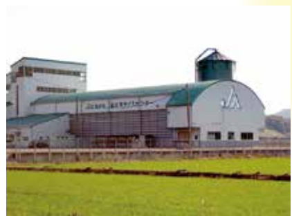
富地原ライスセンター